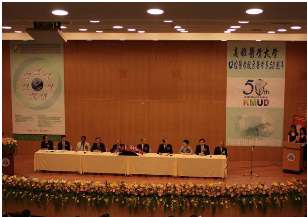
全球卓越口腔健康研究發展中心開幕儀式